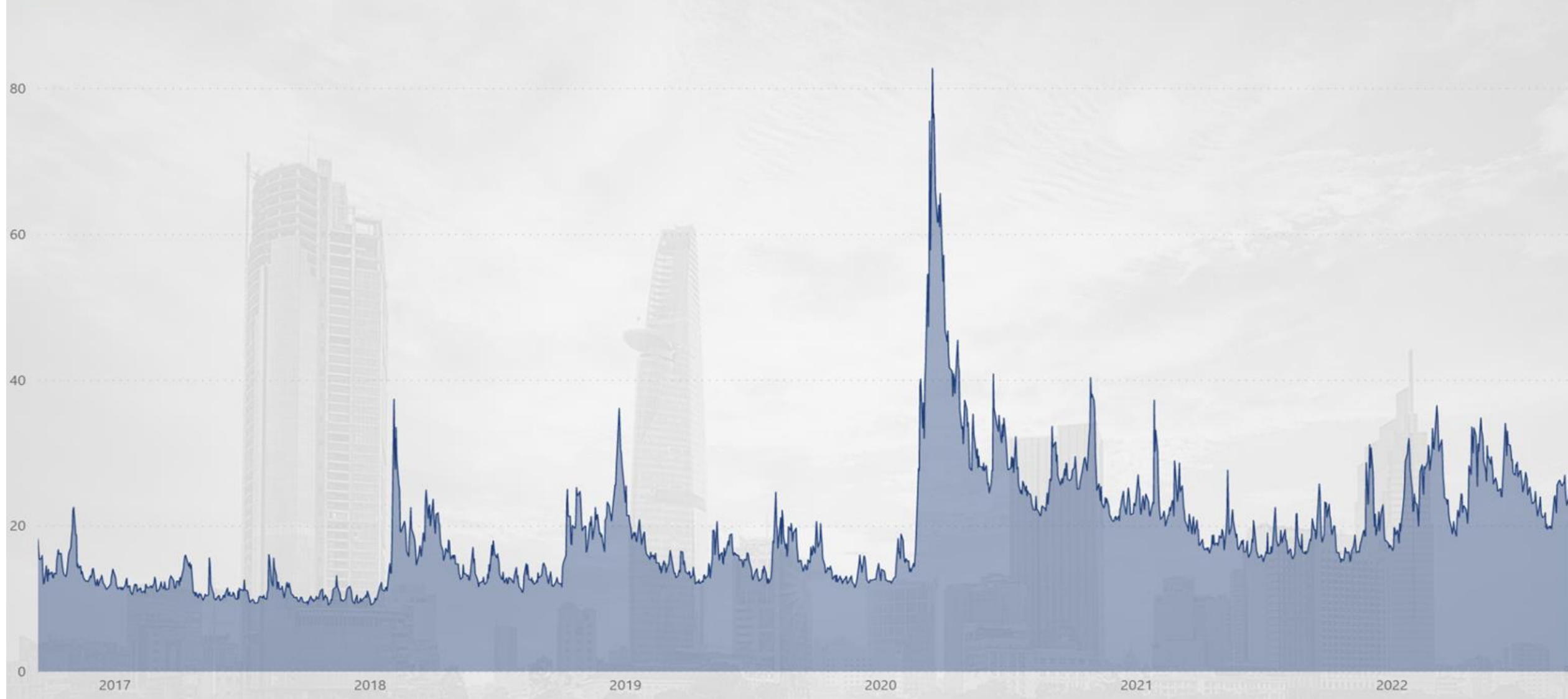
S&P 500 VIX