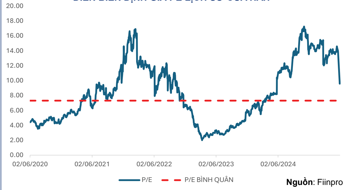
DIỄN BIẾN ĐỊNH GIÁ PE LỊCH SỬ CỦA HAH